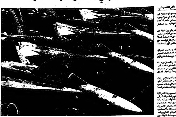
الفرات الاميركية كانت في حال الاستعداد لتحرير العراق يوم السبت (17 تشرين الثاني)

بغداد - من فارق شكوك: وزير الدفاع الاميركسي بي. هاملتون في واشنطن، أعلن انه قد تراجع عن اشتراط ضمانات اضافية من بغداد لتجنب الهجوم على العراق. وقال هاملتون ان واشنطن قد قررت ان لا تطلب من العراق تقديم ضمانات اضافية لتجنب الهجوم على العراق. وقال هاملتون ان واشنطن قد قررت ان لا تطلب من العراق تقديم ضمانات اضافية لتجنب الهجوم على العراق.